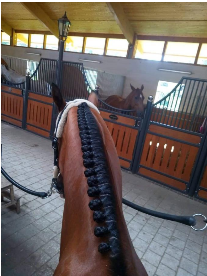
Przykład prawidłowo zaplecionej grzywy (fot. i wykonanie Magdalena Dziubińska).